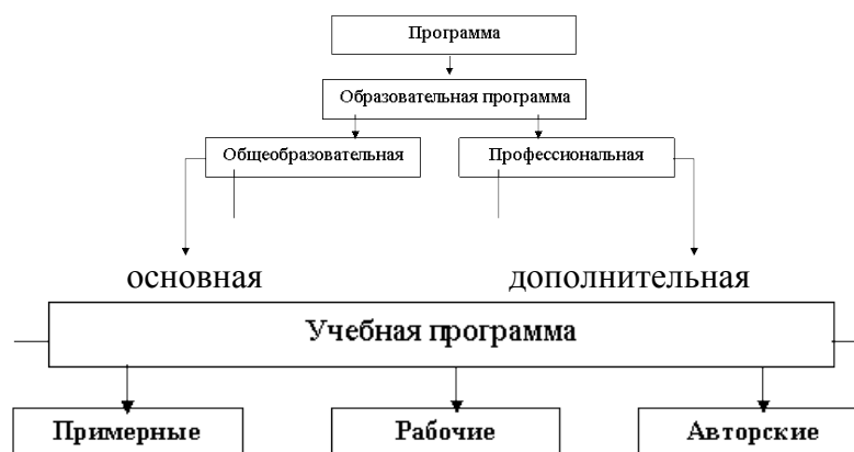
Схема категориальной иерархии образовательных программ

адаптивные модифицированные интегрированные